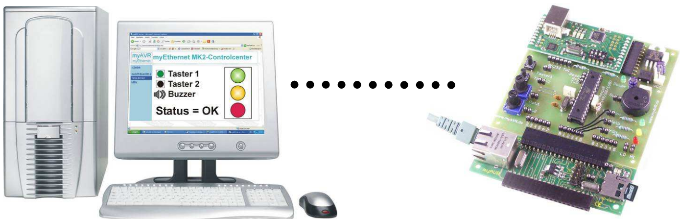
Abbildung / photo :

myEthernet mit dem myTWI Temperatursensor LM75, Temperaturanzeige im Internet Explorer myEthernet et le capteur de température myTWI LM75, barre de température sous Internet Explorer