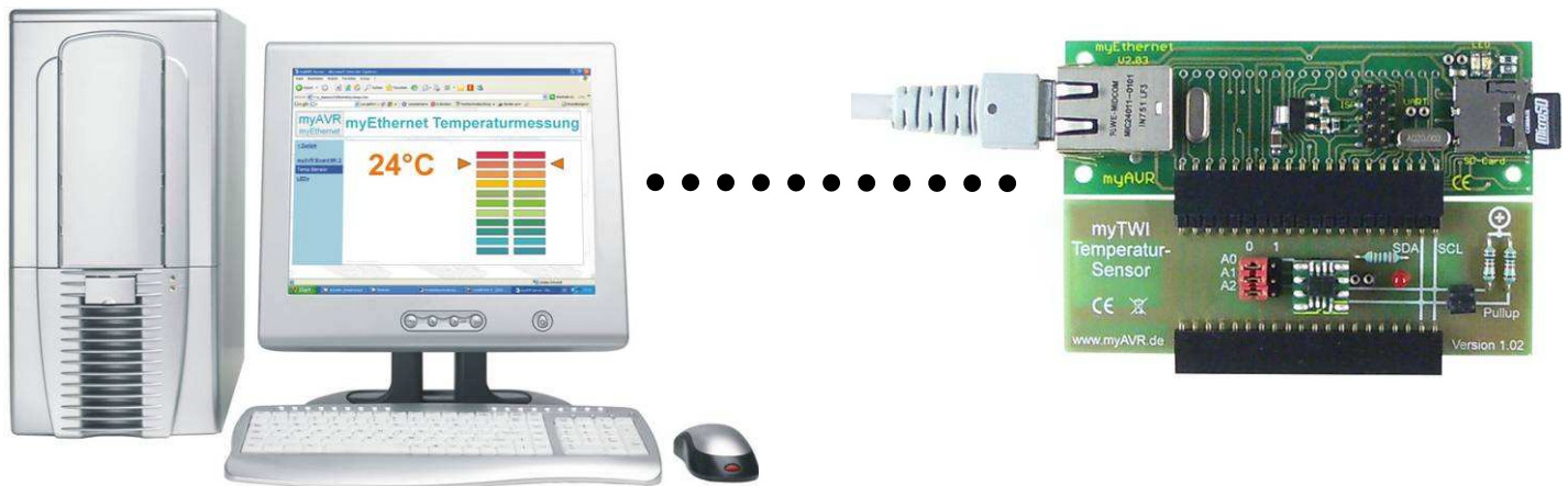
Abbildung / photo :

myEthernet mit dem myTWI Temperatursensor LM75, Temperaturanzeige im Internet Explorer myEthernet et le capteur de température myTWI LM75, barre de température sous Internet Explorer