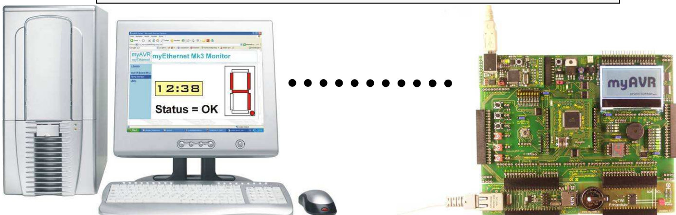
Abbildung / photo :

myEthernet am myAVR Board MK2 USB, Statusübermittlung und Visualisierung im Internet Explorer myEthernet et la carte myAVR MK2 USB, affichage du statut sur Internet Explorer