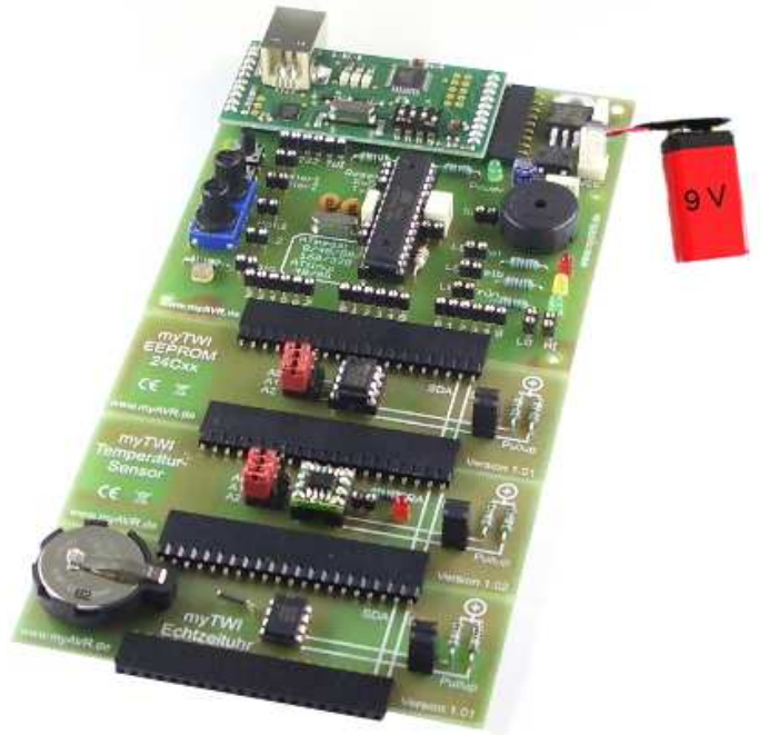
Abbildung / picture: myAVR Board MK2 mit myAVR LCD Add-On myAVR board MK2 with myAVR LCD Add-On